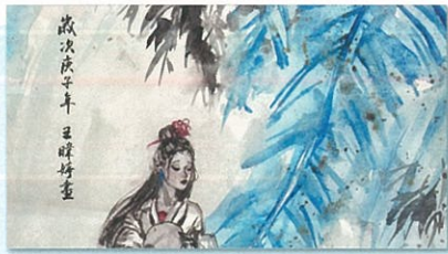
學生作品 - 水墨畫類

美術規劃西畫、水墨畫等分組課程，長期陶冶學生的美學與氣質。並規劃復興藝廊，提供學生展現作品的機會。