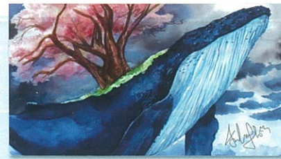
學生作品 - 西畫類