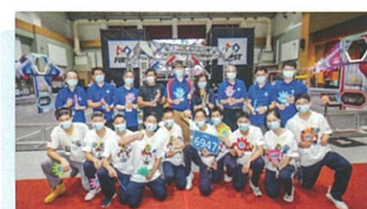
Taipei Fuhsing Robotics Club