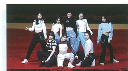
Revel Dance Team