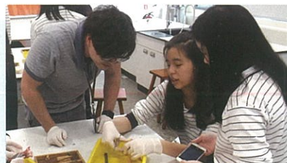
Chicken Wing Dissection

自然科融入大量探究與實作(Inquiry-based learning)，讓學生在實驗中融會科學的原理。